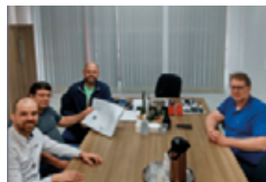
Reunião Da Elsa Mette