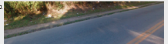
Rua Pomerode - Antes