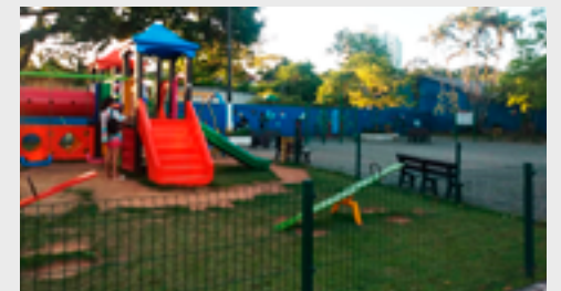
Praça Arnaldo Machado da Veiga