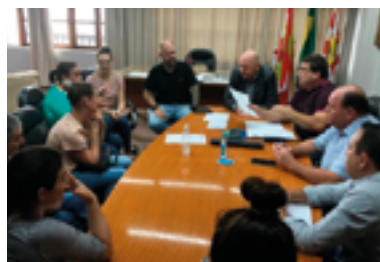
Reunião Theobaldo Sperber