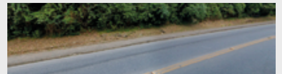
Rua Pomerode - Depois